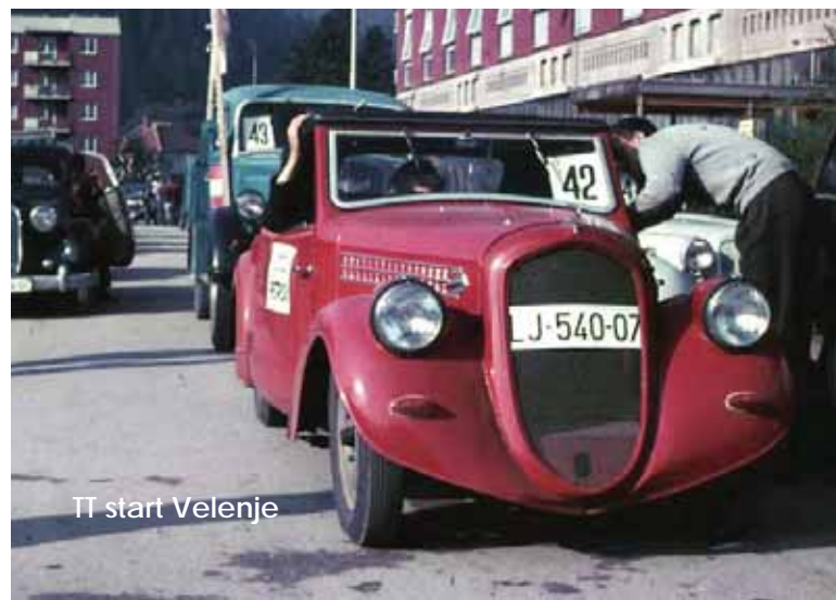
TT start Velenje

Proga letošnjega maratona je bila v velikem delu speljana po cestah, kjer je bila v zgodnjih 50. letih prejšnjega stoletja speljana proga »Jugoslovanske alpske vožnje«. Le, da je šlo to letos v nasprotni smeri, torej z Bleda čez Kranjsko Goro na Vršič in čez Bovec, Tolmin ter Most na Soči do Petrovega Brda, čez Sorico do Bohinjske Bistrice in Ukanca, potem pa spet nazaj do Bleda. Zakaj posebej omenjam mednarodno avto-moto tekmovanje »Jugoslovanska alpska vožnja«, ki jo je Avto-moto zveza Slovenije prirejala v letih med 1952 in 1955? Zato, ker so takrat prvič pri nas s posebnimi priznanji nagradili udeležence s »starimi« vozili. Seveda