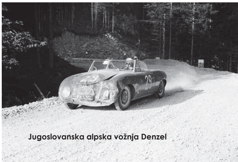
Jugoslovanska alpska vožnja Denzel

Letošnje leto je trojno jubilejno leto, saj hkrati beležimo 25-letnico ustanovitve starodobniškega kluba Codelli - organizatorja tradicionalnega tekmovanja »Slovenija Classic Marathon«, ki je bila tokrat kot prva tovrstna prireditvev pri nas uvrščena na koledar mednarodne starodobniške zveze FIVA in je bila hkrati kot prvo starodobniško tekmovanje pri nas izpeljana pod patronatom UNESCO, 50-letnico FIVE, ki je letošnje leto proglasila za »World Motoring Heritage Year« in 50-letnico prve »prave« starodobniške prireditve v Sloveniji, to je »TT rallyja veteran«, ki je bil izpeljan jeseni leta 1966.