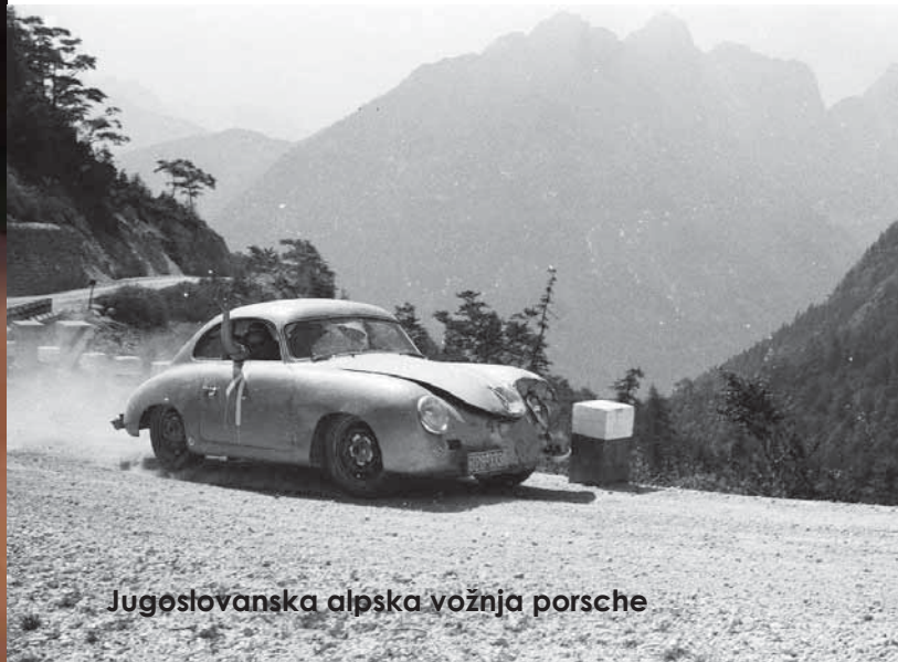
Jugoslovanska alpska vožnja porsche

IN PRVE STARODOBNIŠKE PRIREDITVE PRI NAS