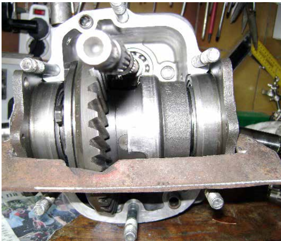
SPONA ZA PRITRDITEV LEŽAJEV