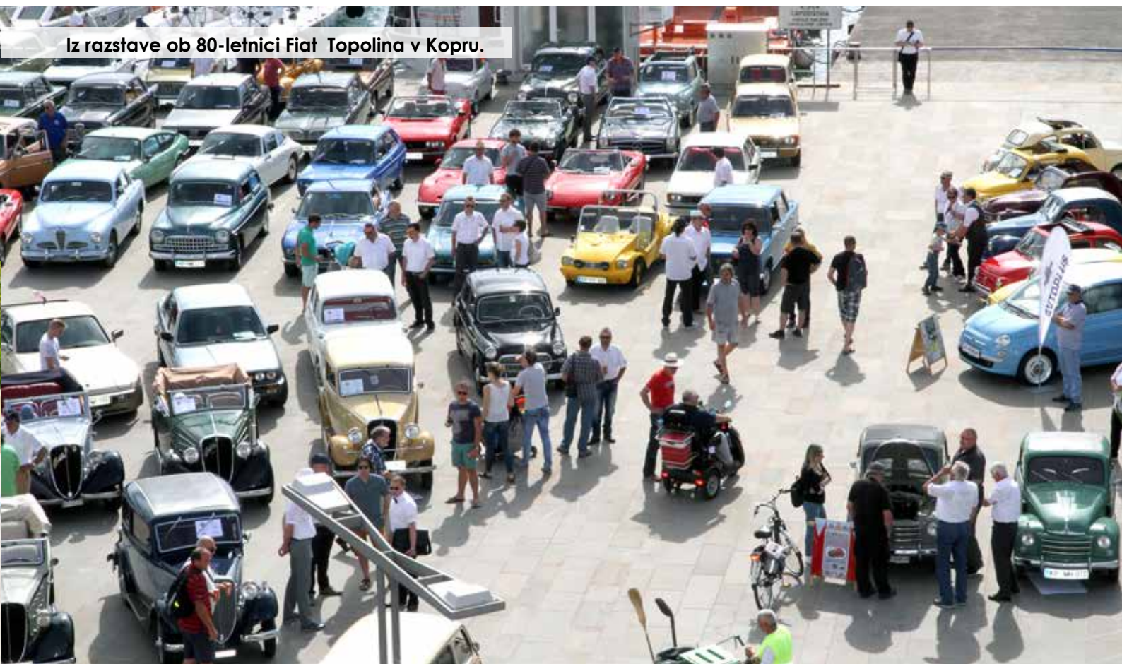
Iz razstave ob 80-letnici Fiat Topolina v Kopru.