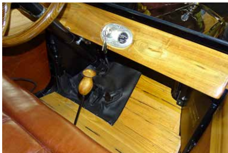
POGLED V NOTRANJOST LESENEGA FORD-A T.