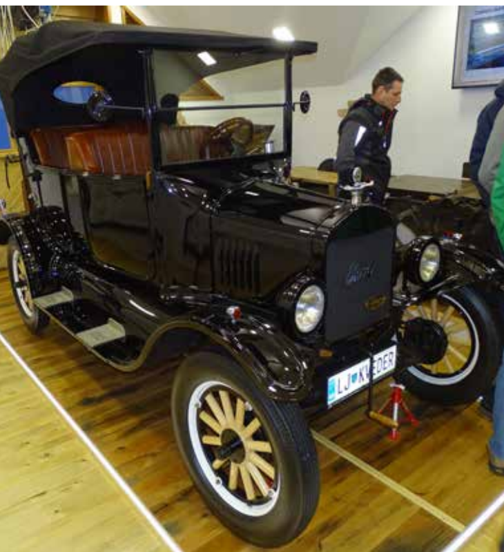
LESENI FORD T JE OD SEPTEMBRA 2021 DALJE PARKIRAN V RAZŠIRJENEM DELU MUZEJA KVEDROVA TIŠLERIJA.