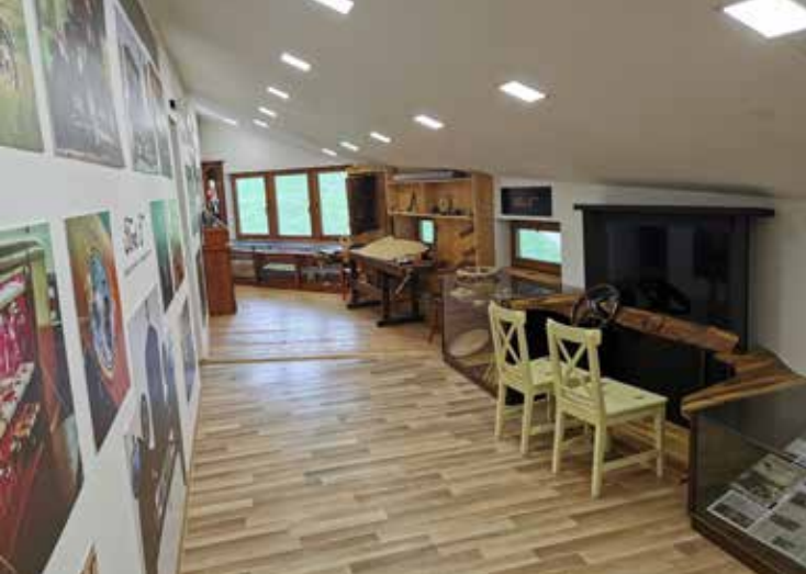
DVA DETAJLA NOTRANJOSTI MUZEJA KVEDROVA TIŠLERIJA.