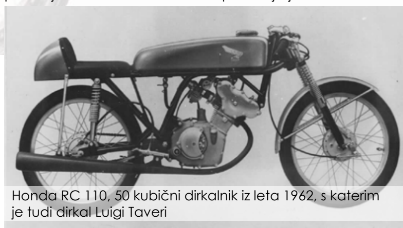
Honda RC 110, 50 kubični dirkalnik iz leta 1962, s katerim je tudi dirkal Luigi Taveri