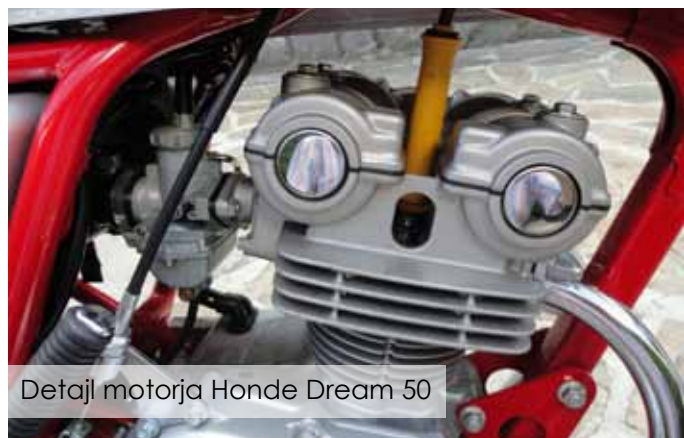
Detajl motorja Honde Dream 50

Sam sem Hondo Dream 50 prvič videl v živo leta 1999