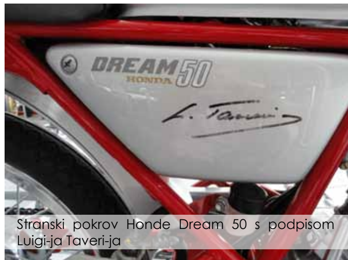
Stranski pokrov Honde Dream 50 s podpisom Luigi-ja Taveri-ja

Zaradi navezovanja na dirkaško preteklost je Dream 50 dobil dolg dirkaški rezervoar za gorivo, kratek sedež z dirkaškim zaključkom, nizko na sprednje vilice