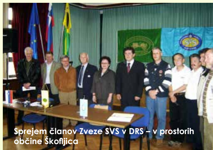
Sprejem članov Zveze SVS v DRS – v prostorih občine Škofljica

V Sloveniji imamo poklicne restavratorje, ki praviloma delujejo v muzejih in restavratorskih centrih za delo pri ohranjanju kulturne in premične tehnične dediščine. To so poklicni restavratorji - konservatorji, ki gredo skozi vse faze predpisanega študija za opravljanje tega poklica. Profilov s področja restavrator - konservator je veliko, npr.: delo na