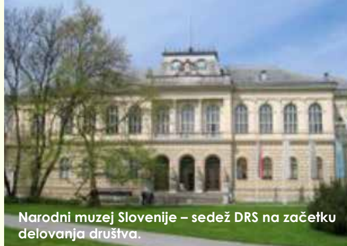
Narodni muzej Slovenije – sedež DRS na začetku delovanja društva.

področju likovne dediščine, kiparskih del, plastike, stenske slike, freske, mozaika, arhitekturnih posegov, seveda delujejo tudi na delu premične tehnične dediščine (TMS, Železn. muzej) itd. Iz delovanja vseh področij restavratorsko konservatorskega dela se vsako leto podeljujejo stanovske nagrade Društva restavratorjev Slovenije v Mestnem muzeju v Ljubljani.