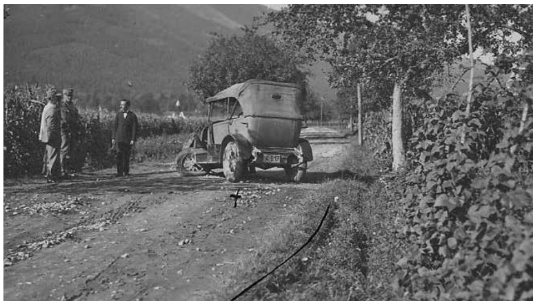
KARAMBOL PRI SLOVENSKIH KONJICAH