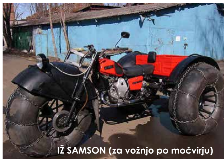
IŽ SAMSON (za vožnjo po močvirju)

Obrat IŽ-Avto je v avgustu leta 2009 vložil predlog za stečaj. Še vedno pa v tem obratu z licenco izdelujejo avtomobile KIA Spectra in Sorento, kakor tudi avtomobile LADA VAZ 21043 (kombi) in IŽ 27175, majhen dostavni avtomobil.