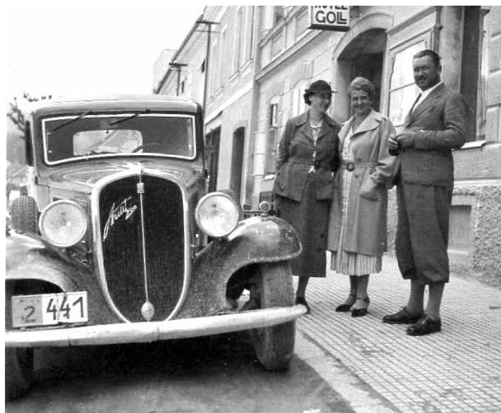
FIAT 518 "ARDITA" V SLOVENJ GRADCU.

Nekaj let pozneje, ob koncu 40. oziroma na začetku 50. let prejšnjega stoletja (leta 1949 ali 1950?), so se pojavile tablice z zvezdo, oznako republike in registrsko številko (8. zamenjava).