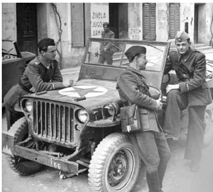
JEEP S TRIGLAVOM IN ZVEZDO.