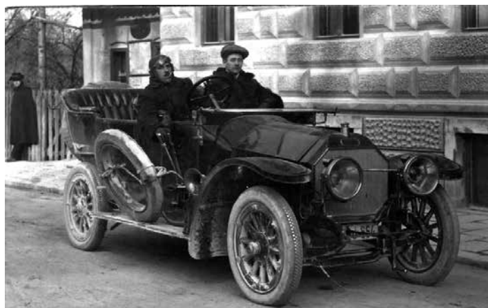
WINDISCHGRÄTZOV AUSTRO DAIMLER V SLOV. KONJICAH. Z NEKAJ NAPORA JE MOGOČE NA TABLICI RAZBRATI ČRKO "J".

To je trajalo do leta 1929, do nastanka Kraljevine Jugoslavije, ko so se pojavile tablice z modro pasico in rdečo številko 2 (3. zamenjava). Rdeča številka je označevala novo teritorialno delitev tedanje kraljevine, in sicer po banovinah: 1 - Uprava mesta Beograda (Zemun, Pančevo),