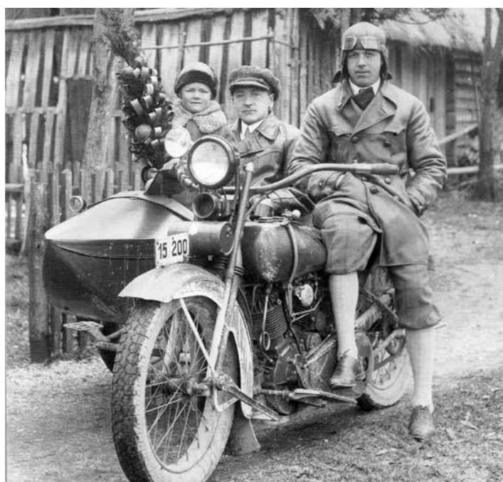
HARLEY – DAVIDSON Z OZNAKO LJUBLJANSKE OBLASTI.