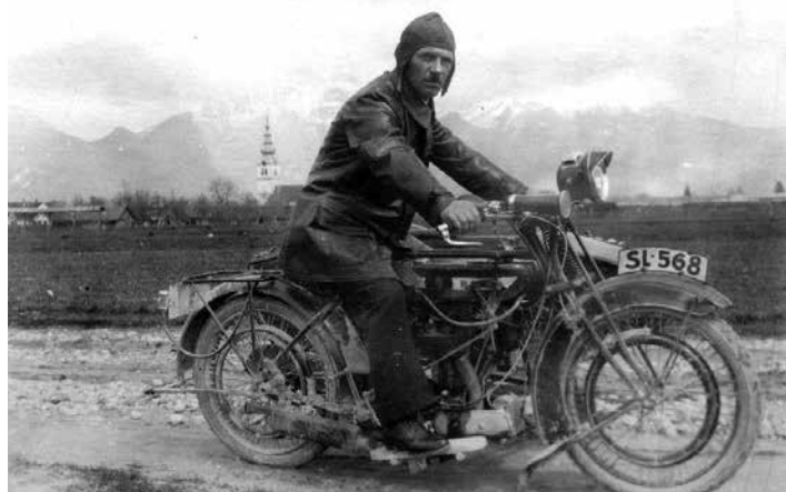
BSA V ŠENČURJU PRI KRANJU.