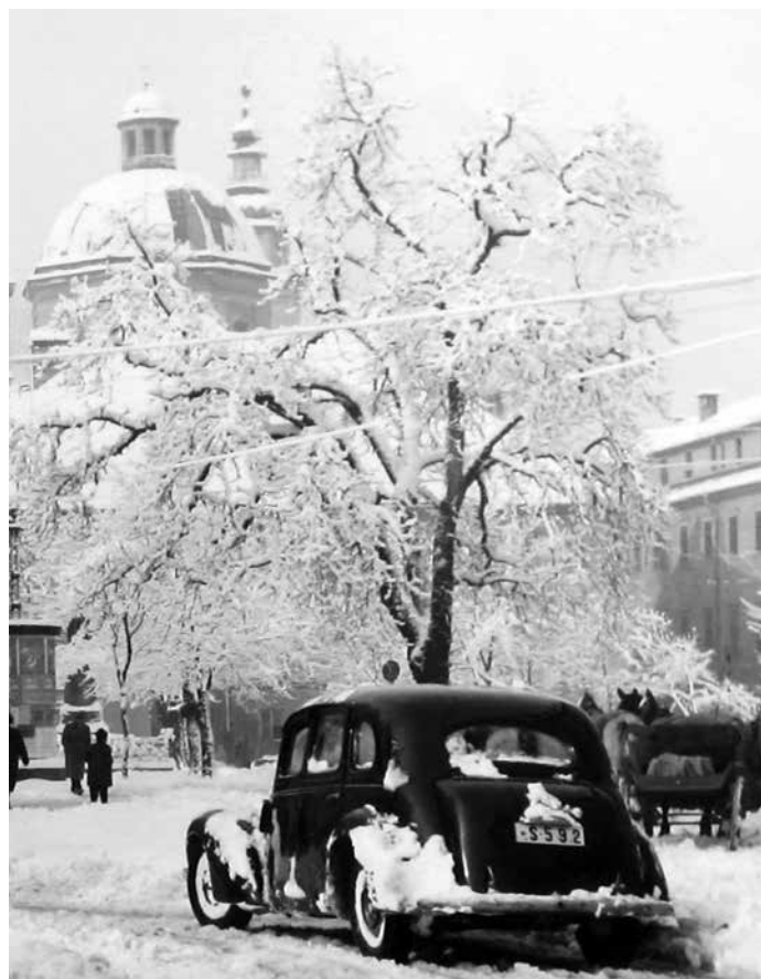
FIAT 1100 BL.