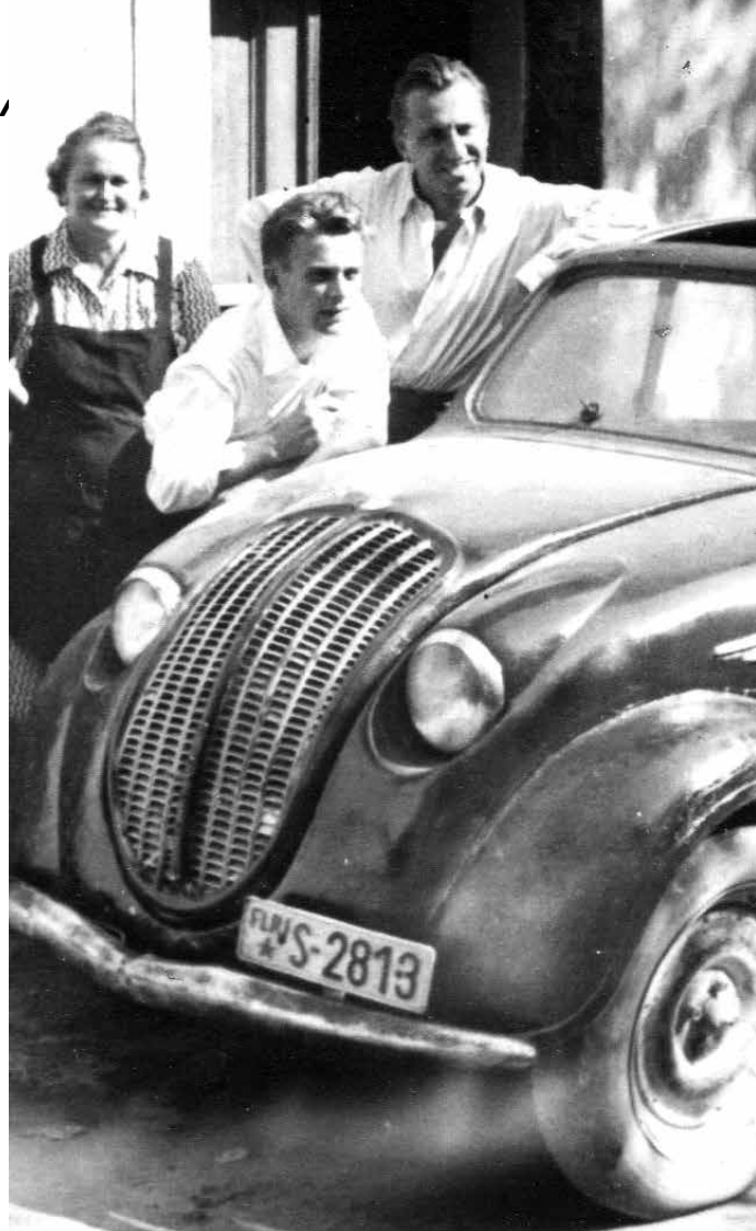
JEEP S TRIGLAVOM IN ZVEZDO.

Tablice z oznako "S" so zdržale vse do jeseni leta 1961, ko so jih zamenjali z novimi tablicami z oznakami krajev (9. zamenjava). Te tablice so imele pravzaprav še najdaljšo življenjsko dobo, saj smo jih uporabljali kar 30 let, vse do osamosvojitve in uvedbe tablic z mestnimi grbi, kot jih poznamo še danes (10. zamenjava), s tem, da smo jim leta 2004, po vstopu v EU podobno kot Britanci, dodali še modro pasico z vencem evropskih zvezdic in kratico SLO.