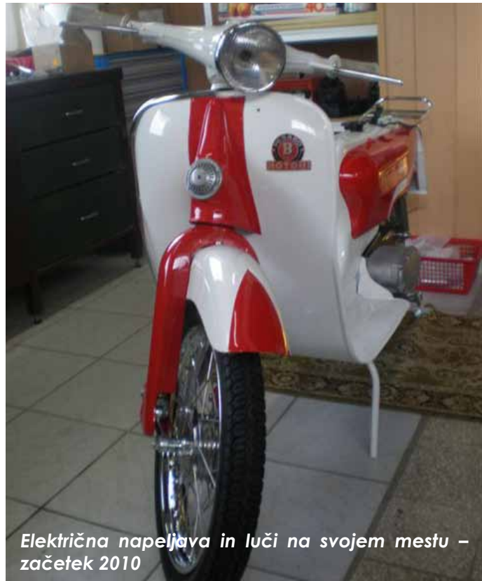
Električna napeljava in luči na svojem mestu – začetek 2010

Delo sem nadaljeval z namestitvijo pletenic zavor, sklopke in plina. Prav tako sem namestil vso električno inštalacijo in luči ter stikala.