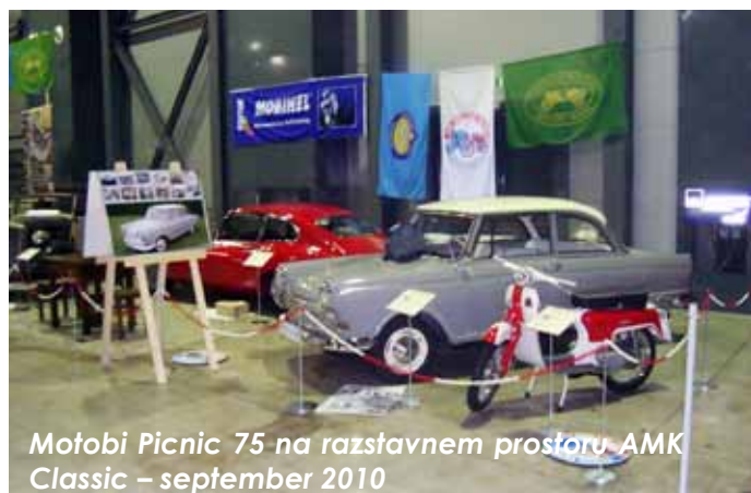
Motobi Picnic 75 na razstavnem prostoru AMK Classic – september 2010

Motor z nameščenim okrasnim pokrovom je eden izmed najbolj markantnih delov na skuterju Motobi Picnic 75