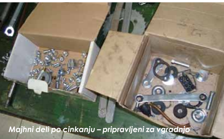
Majhni deli po cinkanju – pripravljene za vgradnjo

Tako sem tudi dal na novo pocinkat ali kromat vse dele, ki so že bili tudi v osnovi galvanjsko zaščiteni. Veliko majhnih delov, kakor tudi vijaki so tako dobili nov sijaj. Pesti koles, ki sta aluminijasti, sem dal polirat do visokega sijaja.