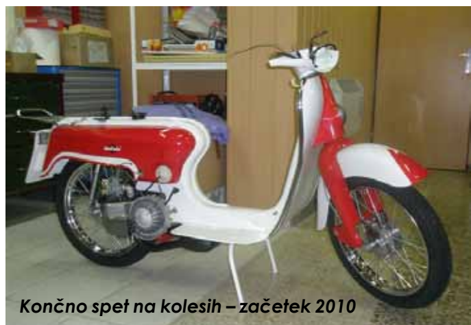
Končno spet na kolesih – začetek 2010

Ko je bila večina delov že pripravljenih, sem počasi začel sestavljati posamezne dele v celoto. Vnaprej sem si pripravil posamezne sklope motorja ter vijake,