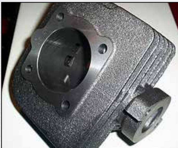
Glava cilindra z vrtino 38 in gibom 43 mm na motorju prodajalca odgovarja primerjavi