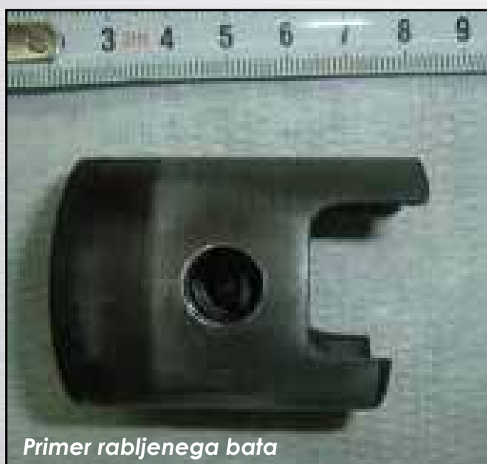
leve fotografije. Odgovarjajoči bati ELKO serijski z dvema