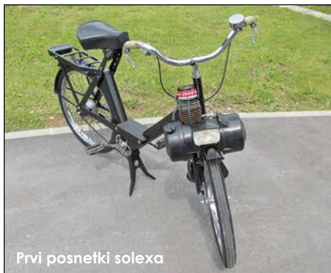
Prvi posnetki solexa

Le-ti so se vse do leta 1980 vgrajevali skoraj v vsa evropska in ruska vozila. Tu niso bila izjema ne Mercedes Benz, Porsche ali kateri drugi proizvajalec. Bili so tako dobri, da so jih proizvajali na japonskem pod licenco v tovarni Mikuni za vsa vozila Mitsubishi, Suzuki in Toyota. Seveda moram omeniti poleg avtomobilov še mnoge motorje in agregate, ki so ravno tako uporabljali solexsove uplinjače.