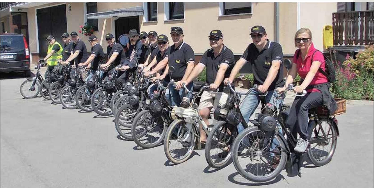
Na obisk h kolegu