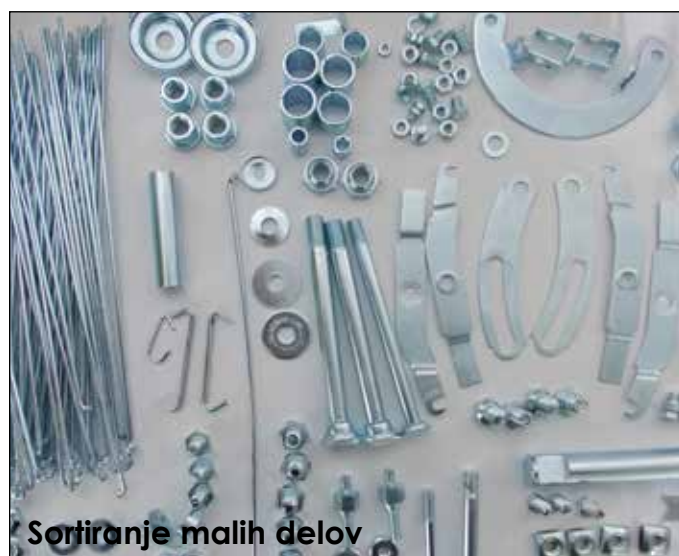
Sortiranje malih delov

Samo razdiranje je bilo zahtevno, ker so bili vijaki in matice zarjaveli. Nekaj se mi jih je polomilo in zato sem si naredil spisek potrebnih novih vijakov. Dobro vijake sem dal v ponovno obdelavo cinkanja. Čeprav