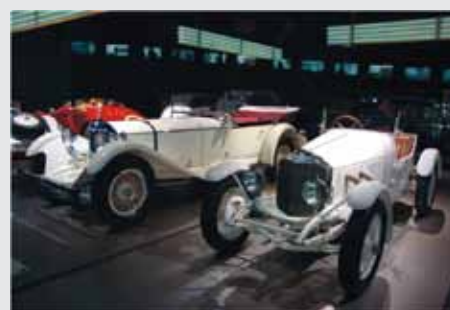
Mercedes Benz Typ SS 1931, Nemčija STARODOBNIK