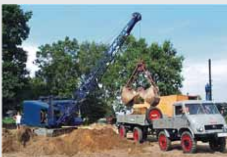
Unimog 1968, Nemčija NI STARODOBNIK