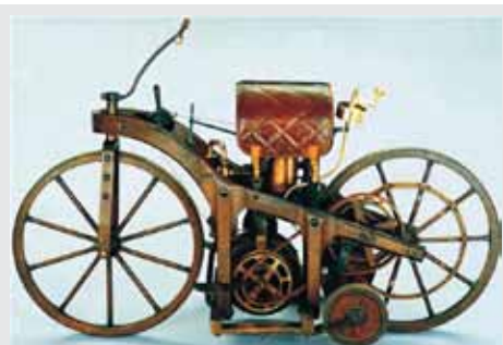
Gottlieb Wilhelm Daimler, Reitwagen 1885, Nemčija STARODOBNIK

Predstave o tem katero vozilo je že izpolnilo pogoje za naziv starodobno vozilo in kako lahko zgleda so različne. Poglejmo si nekaj primerkov in se odločajmo: