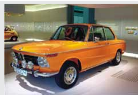
BMW 2002 H 1969, Nemčija STARODOBNIK