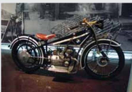
BMW R 32 1932, Nemčija STARODOBNIK