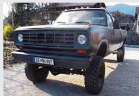
Dodge RAM W 200 1975, ZDA NI STARODOBNIK